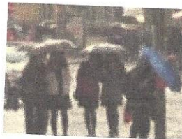
27 İle Kuvvetli Yağış Uyarısı