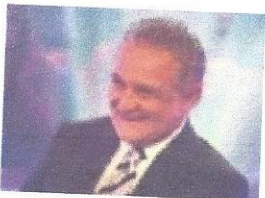
İlk Soruda Elendi Ama...