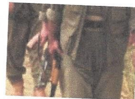
PKK 5 Korucu ve Bir Muhtarı Kaçırdı