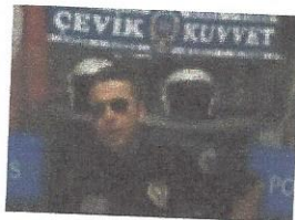
Yok Böyle Polis!